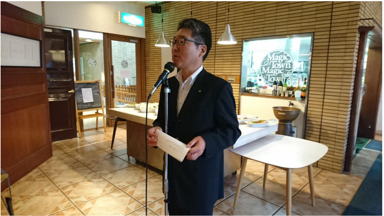
6月分奨学金 誕生日祝 5月7日(日)に祝品(香蘭食事券)