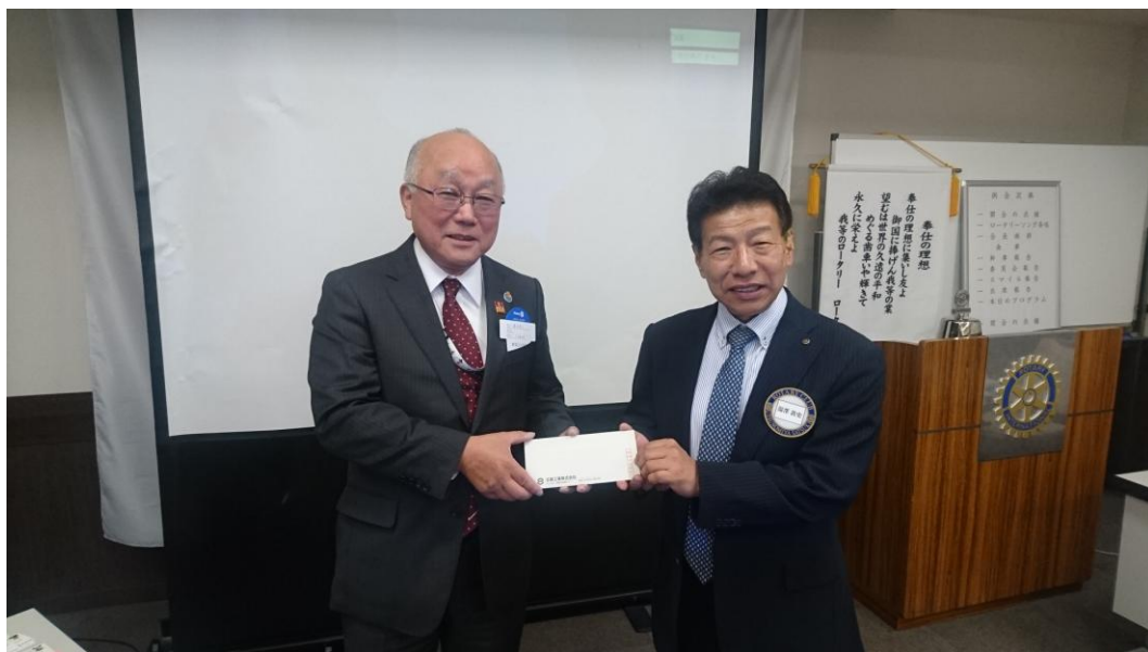
《湯澤会長より謝礼の贈呈》