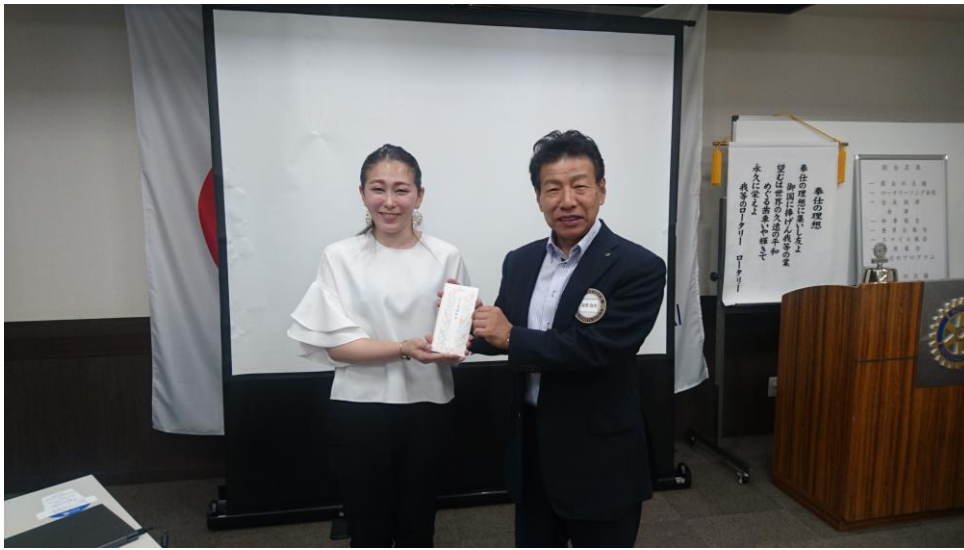
《湯澤会長より謝礼の贈呈》